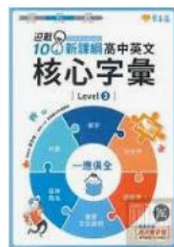
常春藤字彙書 Levels 3&4