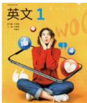
龍騰高中英文第一冊